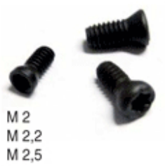
M 2 M 2,2 M 2,5

Materiale: Acciaio bonificato 12,9 HRC 39 - 44 Fosfatate al Manganese nere