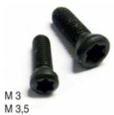
M 3 M 3,5